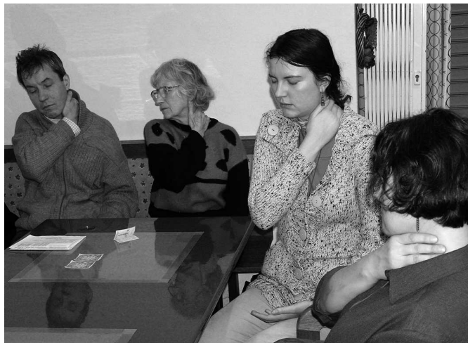
Výuka stimulace krční čakry

Ukázalo se, že je výrobcem a vynálezcem malé novodurové trubičky, která čistí a energeticky nabíjí čeho se