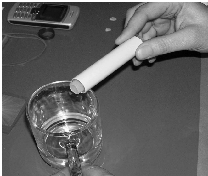
Podvodná „nabíjecí a harmonizační“ trubička