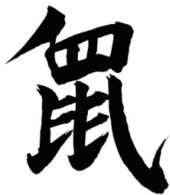
Čínský astrologický znak myši

obracejí se myšlenky Vietnamců ke zvířeti, které bude tento rok oslavováno.