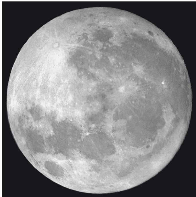
Měsíc v úplňku

Aktuality z internetových stránek německých skeptiků vybral a přeložil Milan Urban