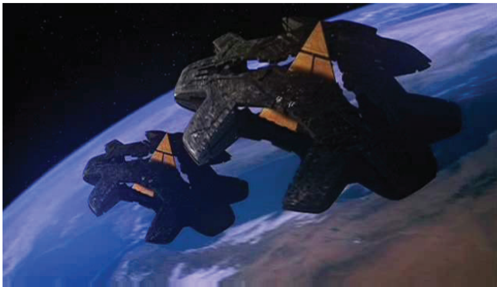
Létající pyramida ve Sci-Fi