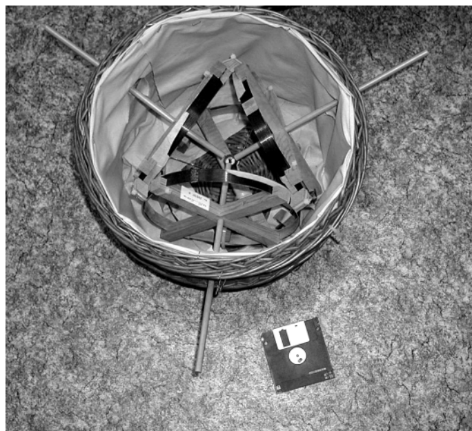
Košík otevřený. Je vystlán růžovou potrhanou látkou, možná proto, aby do něj nebylo skrz proutějí vidět. Uvnitř jsou tři primitivní, velké a úzké dřevěné cívky, na nich je namotaný kousek drátu. Firemní ujištění, že „přístroj“ je odstíněn, působí obzvláště komicky.

Český klub skeptiků hledá i touto cestou oklamané zákazníky, aby se mu ozvali (na adresy v tiráži).