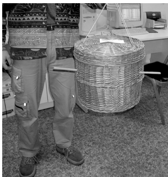
Košík zavřený a zaplombovaný. Proč výrobce zvolil právě košík? Snad proto, že proutějí je lehké, „přístroj“ se totiž věší ke stropu. Nejlevnější stojí 40 000,- Kč.

Ve hře byly desítky tisíc za zázračný proutěný košík, který údajně vysušuje zdi jakousi magnetokinezi. Protože firma vysušuje objekty kromě toho klasickou cestou, a navíc je vysušování samozřejmě dlouhodobé, až dvouleté, laik nezjistí, že košík je podvodný výrobek, který má dostat ze zákazníka vydatnou sumu navíc. Podobné konstrukce bývají výsledkem kutění malých kluků, kteří si z drátků, dřevěk a trubky vyrobí „vesmírnou raketu“.