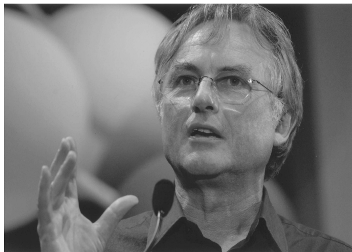
Pátečníci se s oblibou pouští do aktuálních fenoménů.