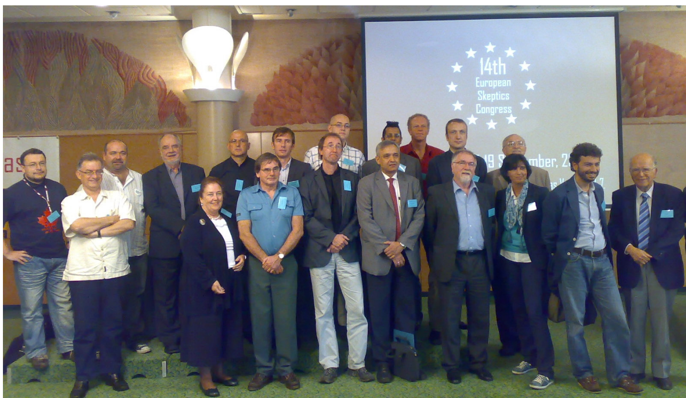
Přednášející na kongresu ECSO v Budapešti.