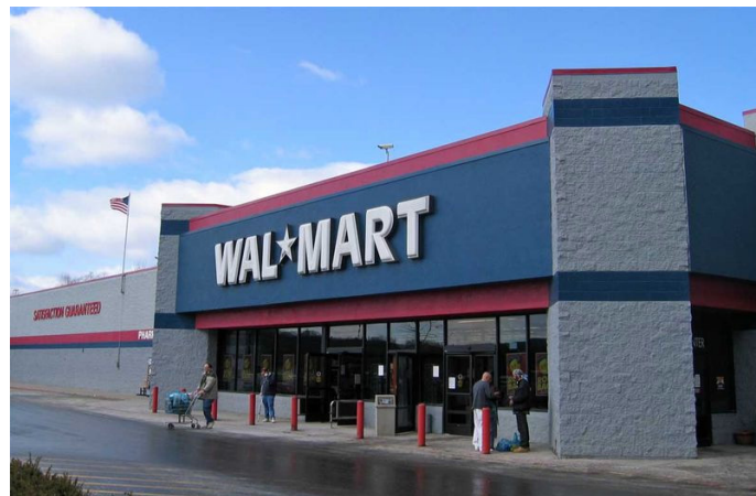
Je libo homeopatika? Stačí si skočit do Wal-Martu.

V Česku se stejně jako v jiných státech Evropské unie na homeopatika nahlíží jako na léčivé přípravky a to navzdory tomu, že před uvedením na trh nemusí dokazovat svoji účinnost, pouze bezpečnost. Z pohledu zákona tedy nejde jen o „cukrové kuličky“, ale o léčivý přípravek, byť nemusí prokazovat svoji účinnost. Tedy, to že se homeopatika prodávají v lékárnách anebo je doporučují sami lékaři, nic nevypovídá o jejich účinnosti. Pouze je jisté, že vám jejich užívání nemůže ublížit. Je to podobné jako s potravinovými doplňky, ty taky nejsou zkoumány z hlediska účinnosti, ale pouze bezpečnosti. „V případě homeopatických přípravků v ředěních, která jsou k dispozici na trhu v ČR, by nemělo dojít k ohrožení zdraví pacienta ani v případě, kdy pacient přípravek použije nesprávně,“ informuje na svých stránkách Státní ústav pro kontrolu léčiv (SÚKL). „U takto registrovaných přípravků není v rámci registračního řízení vyžadováno klinické hodnocení přípravku (kontrola účinnosti), na jehož základě by Státní ústav pro kontrolu léčiv mohl schválit doporučené indikace u homeopatických přípravků,“ stojí dále na stránkách SÚKL. Oficiál-