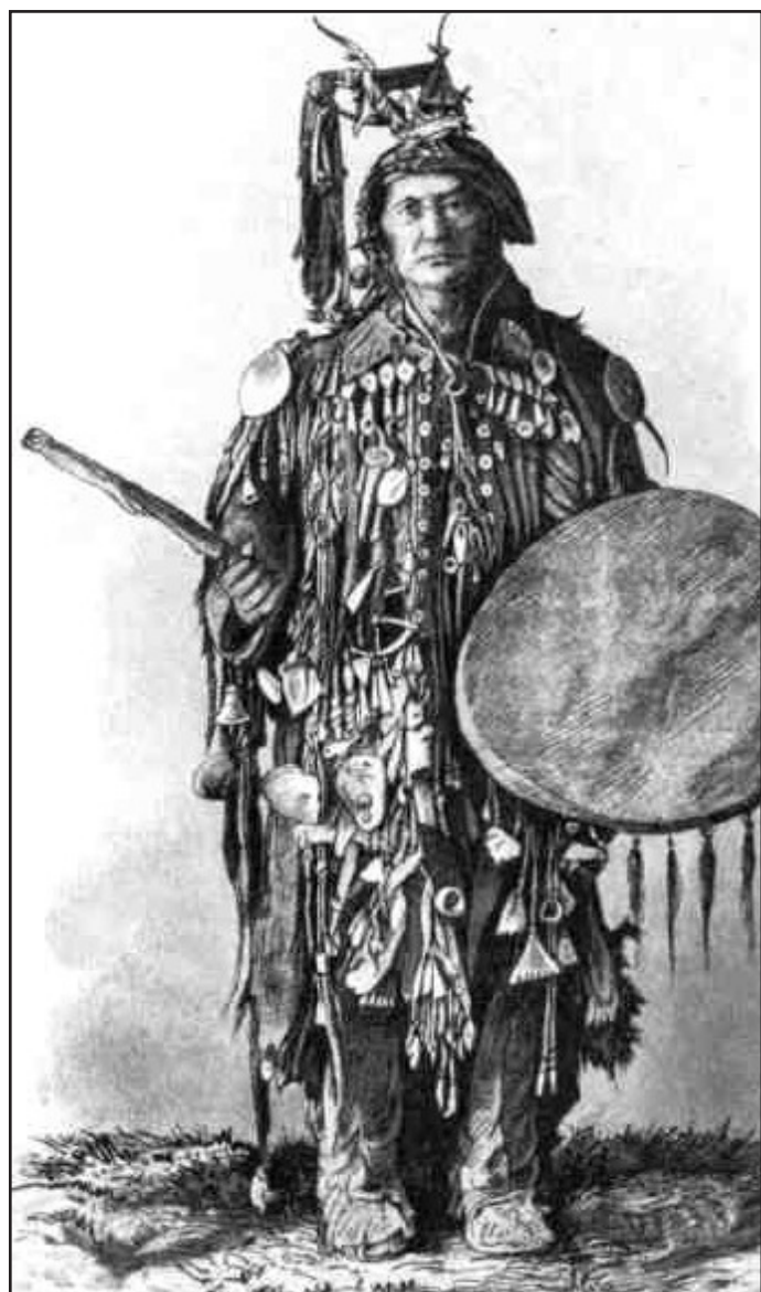
Pop-psychologové si pletou vědu se šamanismem. Případně se zábavním průmyslem.

Psycholog Veselý společně se svou ženou (původně zdravotní sestrou, jež před pár lety „zemřela a narodi-