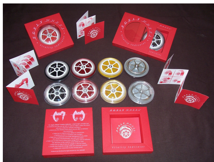
Obr. 1 Fotografie Egelyho kolečka.

V tomto článku posoudíme, zda rotaci Egelyho kolečka lze vysvětlit bez telekineze, jen z poznatků fyziky. Vycházíme z popisu zařízení a z odůvodnění původ-