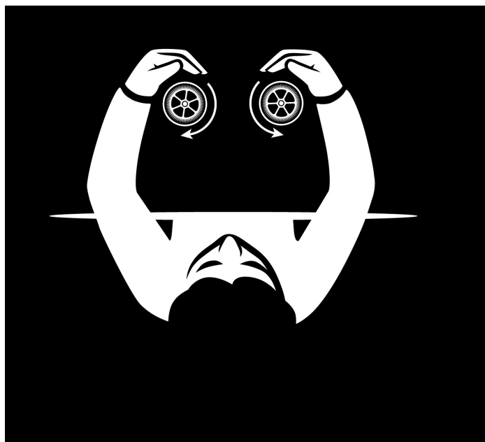
Obr. 2 Náčrtek rotace kolečka po přiložení ruky.

V dalším ukážeme, že hlavní tvrzení autorů patentu obsažené v bodě 1), z kterého jsou odvozena tvrzení ve výše uvedených bodech 2) a 3), je mylné, protože Egelyho kolečko je ve skutečnosti tepelný stroj, jehož funkci je možné plně popsat zákony klasické fyziky. Stroj využívá rozdíl mezi teplotou lidské ruky a teplotou okolního vzduchu k transformaci tepelné energie na energii mechanického pohybu vzduchu, který následně vyvolává rotaci ozubeného kolečka. Obvodová rychlost rotace kolečka při tom nemůže být větší než je rychlost vzdušného proudu, který kolečko pohání. Konkrétní mechanismus pohonu kolečka v použité konfiguraci lze popsat takto: Kontaktem s povrchem ruky živého člověka se vzduch zahřívá, stoupá vzhůru, na jeho místo postupuje neohřátý vzduch z okolí a nesymetrický tvar ruky pozmění proudění tak, že obsahuje i složku tečnou ke kolečku. Ta zasáhne část obvodu kolečka a roztočí ho. Rychlost rotace se ustálí, když tření v ložisku a brždění části obvodu kolečka o vzduch vyrovná hnací sílu vodorovné složky proudícího vzduchu. Působení proudu vzduchu na ostré hroty obvodu kolečka je obdobné působení proudu vody na lopatky rotoru Francisovy vodní turbíny. Stator Egely-